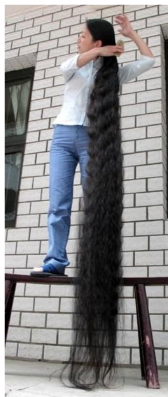
Nejdelší vlasy na světě