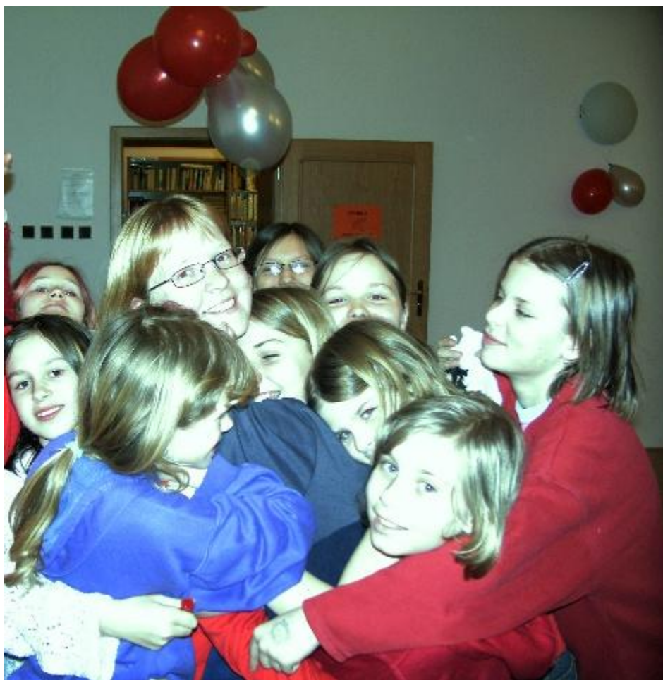
Noc s Andersenem, 2. - 3. 4. 2004

Vydává Obecní knihovna Jinačovice. 6. ročník. 61. číslo Toto číslo vyšlo v lednu 2009.