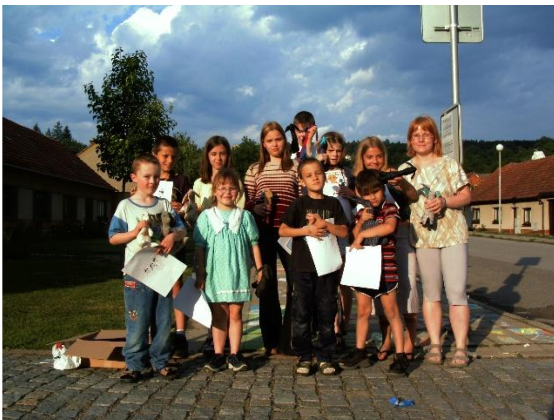
Malování na chodníku, 9. 6. 2004

Vydává Obecní knihovna Jinačovice. 6. ročník. 65. číslo Toto číslo vyšlo v květnu 2009.