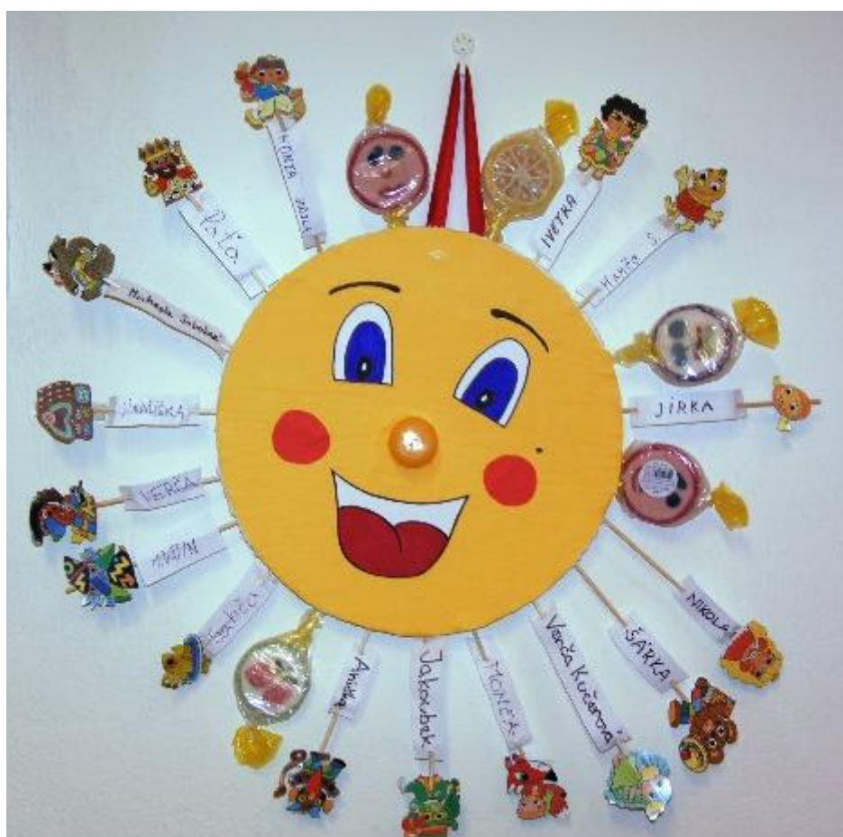
Sluníčko přátelství (přátel knihovny) visí v knihovně od prosince roku 2004

Vydává Obecní knihovna Jinačovice. 6. ročník. 66. číslo Toto číslo vyšlo v červnu 2009.