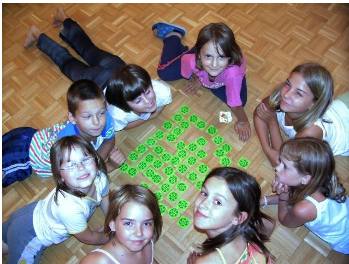
Celoprázdninová soutěž "Po stopách Harryho Pottera", červenec-srpen 2004

Vydává Obecní knihovna Jinačovice. 6. ročník. 67. číslo Toto číslo vyšlo v červenci 2009.