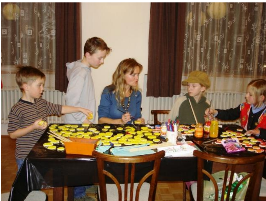
Charitativní dílnička - malování sluníček - 28. 11. 2008

Vydává Obecní knihovna Jinačovice. 6. ročník. 68. číslo Toto číslo vyšlo v září 2009.